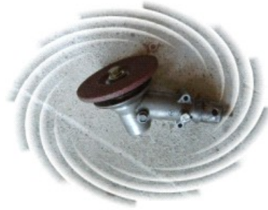
Q-TOOL setelah siap proses fabrikasi